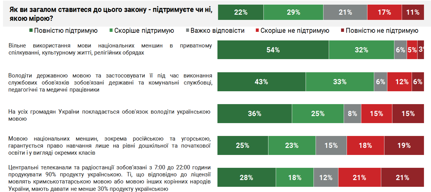
Рис 3. Рівень підтримки окремих аспектів Закону «Про забезпечення функціонування української мови як державної»

Різниця також наявна в підтримці різних аспектів закону залежно від мови спілкування опитаних. Загалом 46% українців вдома розмовляють українською, 30% - однаково часто українською і російською, 24% - російською. Очікувано, переважна більшість населення, яке найчастіше у повсякденному житті спілкується українською мовою, підтримує зазначені аспекти закону (від 73% до 89% у цій підгрупі підтримують різні аспекти Закону). Однак і населення, яке спілкується переважно російською мовою, виявляє порівняно високу підтримку обов'язку державних і комунальних службовців, педагогічних і медичних працівників володіти державною мовою (підтримує 52% у цій підгрупі), а третина (35%) підтримує обов'язок усіх громадян України володіти українською мовою. Серед тих, хто спілкується і російською, і українською мовами, найвищу підтримку (80% у підгрупі) також отримав обов'язок державних і комунальних службовців, педагогічних і медичних працівників володіти державною мовою.