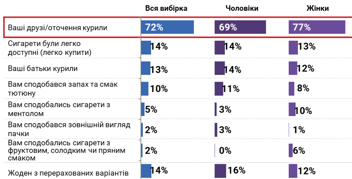
Рис. 2. Розподіл відповідей на запитання «Що більше за все вплинуло на те, що ви почали курити?» (можна було обрати до 3 варіантів відповіді), за статтю

Загалом в межах дослідження було опитано 605 респондентів, серед яких 65% складають нинішні курці, а 35% - колишні курці тютюнових сигарет. Найчастіше кинули курити люди 18-24 років та старше 55 років – вони складають 44% та 47% від генеральної сукупності курців тютюнових сигарет, відповідно. Жінки частіше кинули курити, ніж чоловіки (40% проти 33%, відповідно).